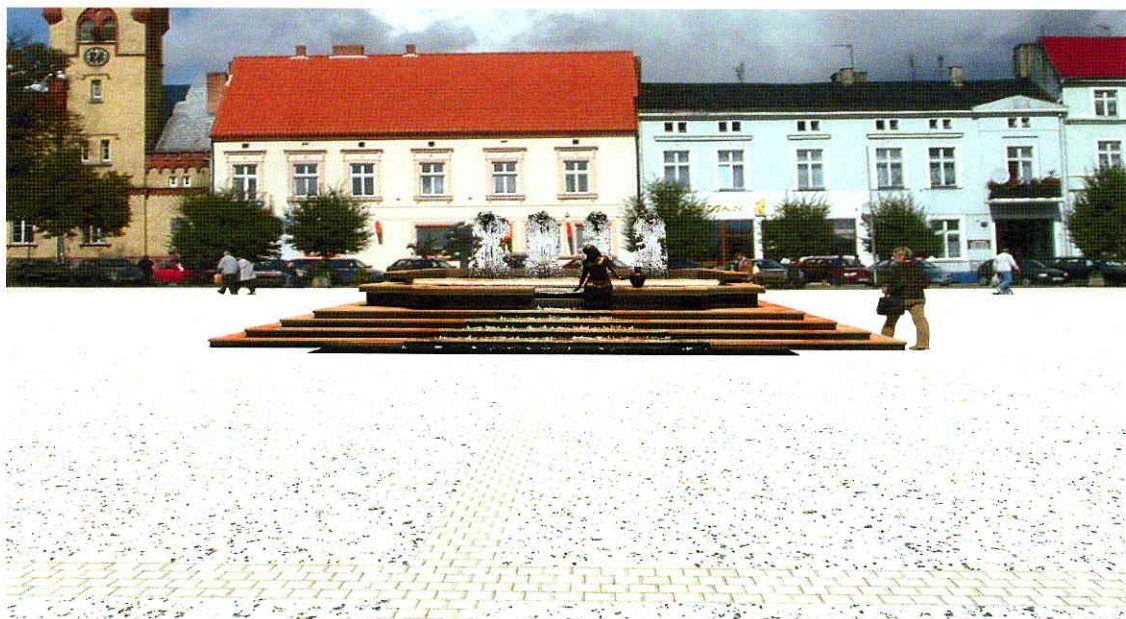
Ryc. Zdjęcie prezentuje projekt fontanny na terenie Dużego Rynku.